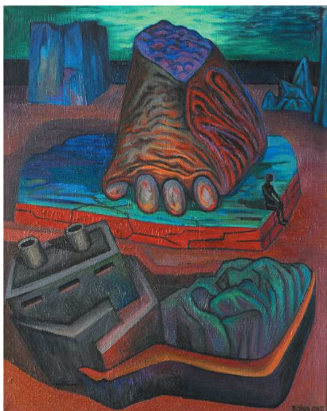
J. Róna, Krajina s lodním vrakem , olej na plátně, 2008

Výstava obrazů, kreseb a plastik Jaroslava Róny z let 1999–2008 představuje poslední proměny tvorby umělce, který stále zůstává věrný svému mýtickému vidění světa a člověka. Na výstavě se setkáme s díly čerpajícími svoji inspiraci ze snových vidin dávné minulosti, temnými obrazy současného světa či apokalyptickými vizemi budoucnosti, scénami plnými destrukce a násilí stejně jako něhy a tajemného kouzla, scénami plnými snové fantazie.